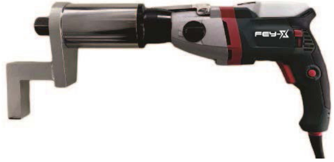
FV-ED14, FV-ED20, FV-ED80

Hassasiyet, güç ve güvenliğin gerekli olduğu ağır hizmet sektörlerinde kivata güvenliği veya sökme için yeni nesil V-ED serisi elektrikli tork anahtarları. Maksimum 8000 Nm tork kapasitesinde sürekli, kararlı ve kontrol edilebilir tork çıkışı sağlar.